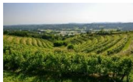
AOP Corrèze, Coteaux de la Vézère

De 2009 à 2017, les vins produits en Corrèze bénéficiaient d'une Indication géographique protégée (IGP). Le 3 mai 2017, le CNAOV a voté la reconnaissance de l'Appellation d'origine contrôlée « Corrèze ». Ils sont désormais reconnus en Appellation d'origine protégée (AOP) depuis le 22 février 2023. L'AOP « Corrèze » se décline autour de vins tranquilles rouges et blancs et de « vin de paille ». Une dénomination géographique complémentaire « Coteaux de la Vézère » est également prévue et réservée aux vins tranquilles rouges et blancs sec.