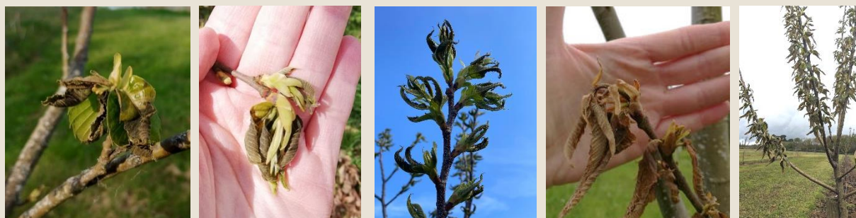
Symptômes de gel sur bourgeons de châtaignier en développement, avril 2024, source GT châtaigne SO

Les températures observées entre le 19 et le 22 avril, allant de -1.5^{\circ}\text{C} à -4^{\circ}\text{C} , ont pu causer par secteur des dégâts de gel sur les jeunes plantations de châtaigniers (1 à 5 ans) ainsi que sur des vergers en production . Des symptômes ont été signalés sur l'ensemble du bassin, dans le Lot, Corrèze, Dordogne et Haute-Vienne. L'intensité est variable et il est pour le moment trop tôt pour en connaître l'impact sur la production. Les syndicats de producteurs avec l'appui des chambres d'agriculture ont alerté les pouvoirs publics.