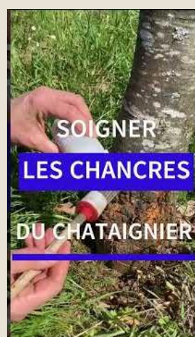
Vidéo : Méthode d'application par "griffure" du chancre. Plus d'informations techniques en vous abonnant au bulletin technique châtaigne sud-ouest.

*Le Syndicat National Des Producteurs de Châtaignes regroupe l'ensemble des syndicats des départements castanéicoles. Les producteurs y sont représentés par le reversement de 10€ de leur adhésion à leur syndicat départemental.