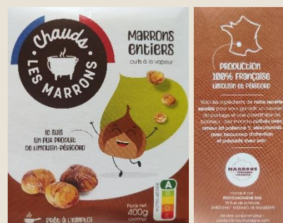
Gamme de marrons entiers sous vide, Marrons du Périgord-Limousin®, InovChataigne