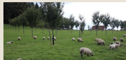
Verger de châtaigniers haute densité, variété Bellefer (87)